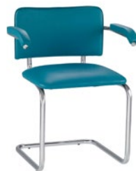
SYLWIA arm chrome

Представляем вашему вниманию новую версию стула для посетителей SYLWIA – SYLWIA lux.