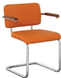
SYLWIA lux arm chrome